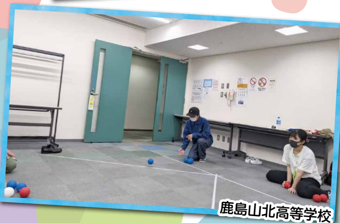
鹿島山北高等学校