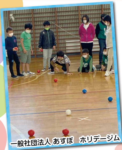
一般社団法人 あすぼ ホリデージム

ジャックボール（目標球）と呼ばれる白いボールに、赤と青のボールを交互に6球ずつ投げたり、転がしたり、他のボールに当てたりしていかに近づけるかを競います。上から投げても下から投げても良いが、投げることができなければ滑り台（勾配具）を使って転がすこともできる、子どもからお年寄りまで一緒に楽しめるスポーツです。