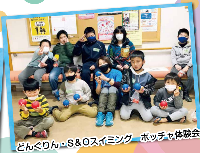
どんぐりん・S&Oスイミング ボッチャ体験会