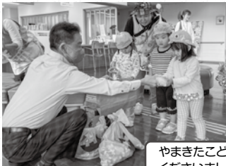
やまきたこども園児の皆さんが、エコキャップを届けてくださいました。いつもご協力ありがとうございます

ポリオ(小児マヒ)ワクチンは1人分20円、キャップ1,000個(約2kg)で1人の子どもの命が救えます。また、キャップを分別回収すると、環境保護と再資源化にも繋がります。今までで累計4,357,125個、約4,357人分のポリオワクチンを贈ることができました。引き続き皆様のご理解ご協力をお願いします。