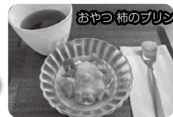
おやつ 柿のプリン