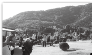
スタート前のラジオ体操