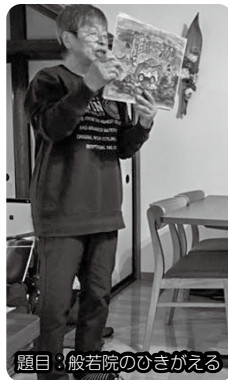
題目：般若院のひきがえる