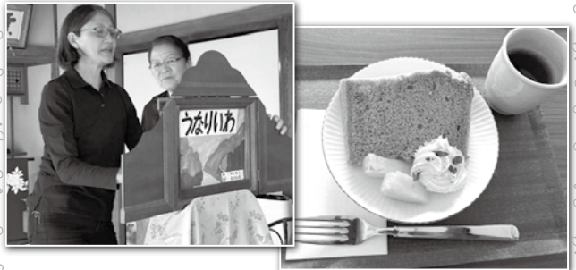
ほうじ茶のシフォンケーキ

やまきた拍子木の会による紙芝居でした。「うなりいわ」「喜一郎新田」「共和牛乳のはなし」など、山北ならではのお話に引き込まれました。