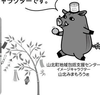
山北町地域包括支援センター イメージキャラクター 山北みまもろう君