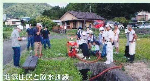
地域住民と放水訓練