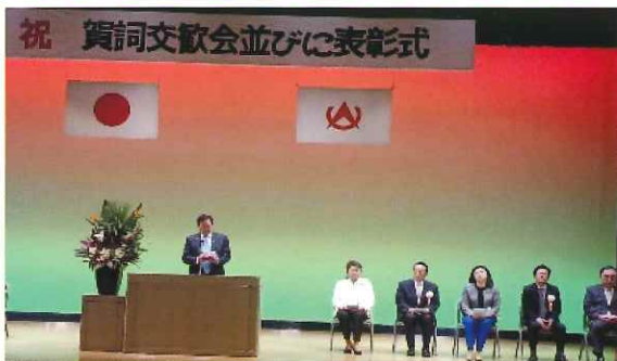
祝 賀詞交歓会並びに表彰式

年に3回、町の広報と一緒に配布される「社会教育委員だより」で、今やっている活動の報告をしています。こちらを読んでいただければ幸いです。