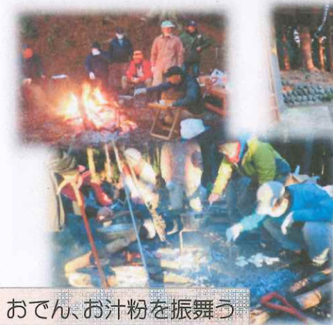
おでん、お汁粉を振舞う