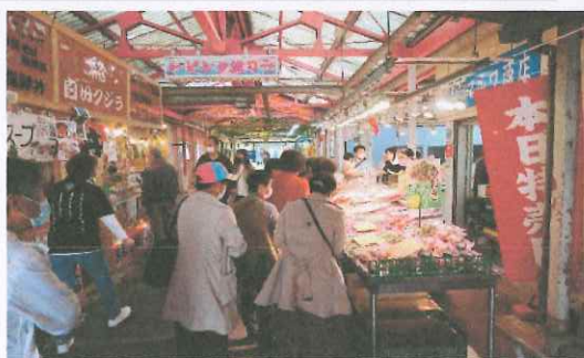
上・右 参加者 焼津港、港めぐり 左 日本最長の木造橋”蓬莱橋”