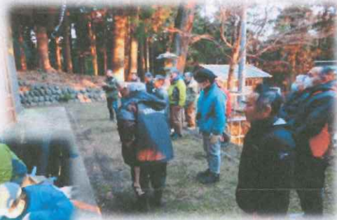
コロナ禍で3年ぶり! 氏子役員他の皆さん がそろって参拝