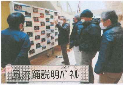
風流踊説明パネル

令和四年十一月三十日(水)登録が決定、共和のもりセンターにお祝いの横断幕が張られ、お峯入り保存庫周辺に黄色のぼり旗が設置されました。また、山北町生涯学習センターでお峯入りパネル展が一月末迄開催。天狗、おかめが会場正面に立ち、お峯入りが紹介されています。