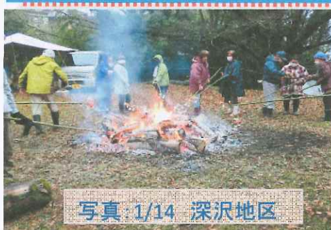
写真 1/14 深沢地区

【編集後記】お峯入りの文化遺産登録が決定、山北町も伝統、文化継承に意欲的です。将来を考え、今することを地域全体で考え取り組みたい。皆様のご意見などお寄せください。(編集担当 江上)