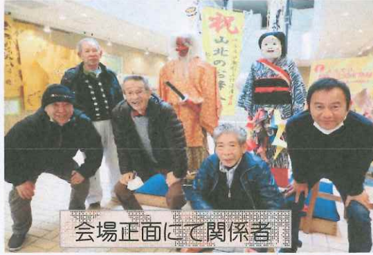
会場正面にて関係者