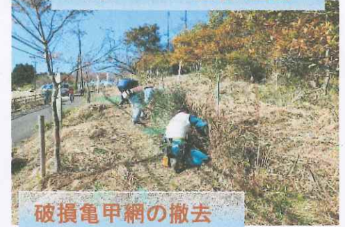
破損亀甲網の撤去