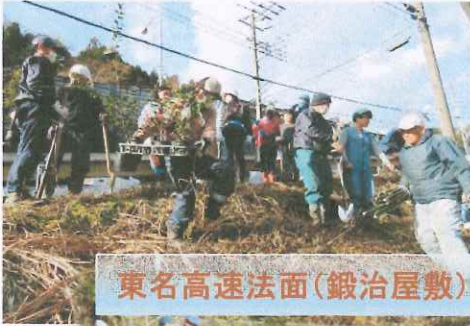
東名高速法面(鍛冶屋敷)12/11 植栽・整備