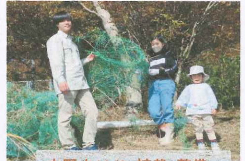
大野山11/6 植栽・整備