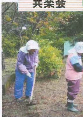
「苗木の学校」草取りが7/26、10/29に行なわれました。