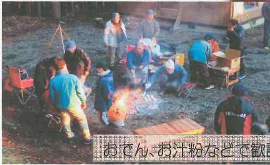
おでん、お汁粉などで歓談