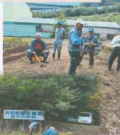
共和地区福祉協議会 苗木の学校