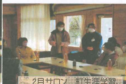
2月サロン 町生涯学習 社協関連の方が来訪