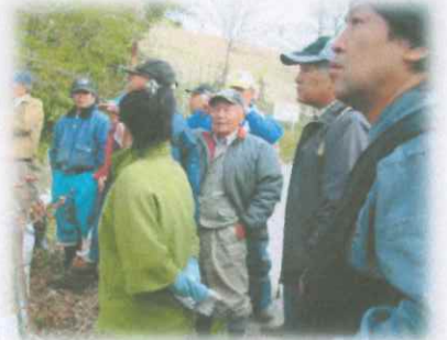
2013.3 山林巡視 大野山