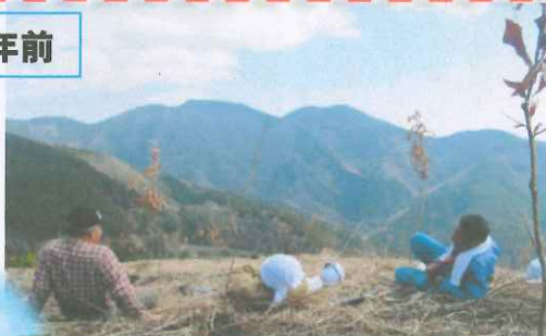
2013.3カサツムリ 植栽作業 直営作業班 一服談笑