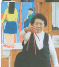
ヒモを使った奇術