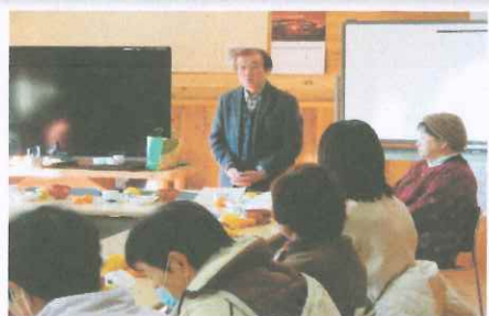
1月サロン 1月17日(金)新年を 迎え会長挨拶、会食懇談