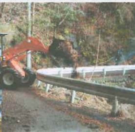
ホイールローダー、プロア

【編集後記】 ロウバイ、ウメ、カワズサクラ、ハナモモ、キブシ、ヤマブキが咲きました。春本番を感じます。(編集担当 江上)