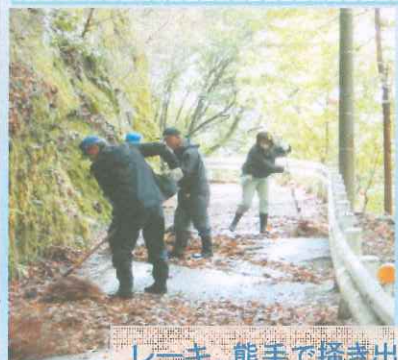
レーキ、熊手で掻き出し

町道：古宿ー深沢、深沢ー鍛冶屋敷、古宿ー鍛冶屋敷 落ち葉、土砂の除去清掃を実施しました。