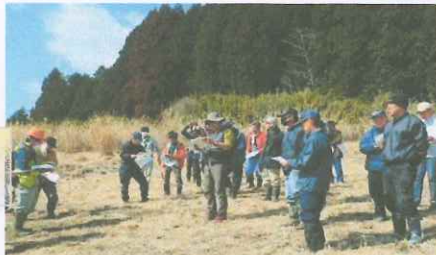
大野山牧場跡地 森林化調査説明