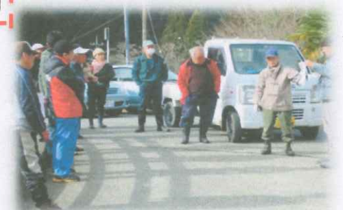
2019.3 山林巡視 八丁