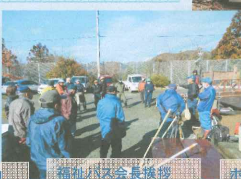
福祉バス会長挨拶