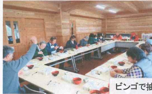
ビンゴで抽選会、お土産に花