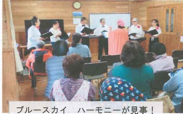
ブルースカイ ハーモニーが見事!