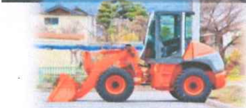
ホイールローダー