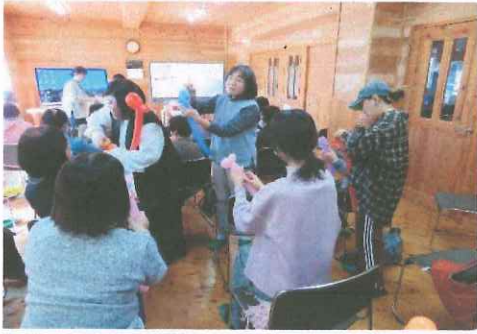
ゴム風船作り R7年11月21日