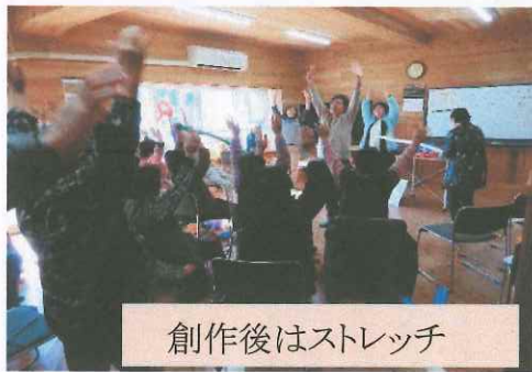
創作後はストレッチ