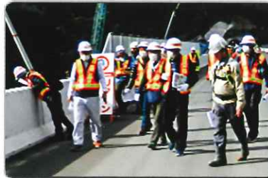
新秦野IC~新御殿場IC間は2027年度開通予定です。

新東名対策協議会は11月21日に現場見学会を実施しました。中日本高速道路秦野工事事務所の案内のもと建設現場や工事進捗状況の説明を受けました。向原地区に架かる上り車線、柳橋の舗装が完了し橋の上を歩くことが出来、工事の進み具合を確認することが出来ました。(広報部)