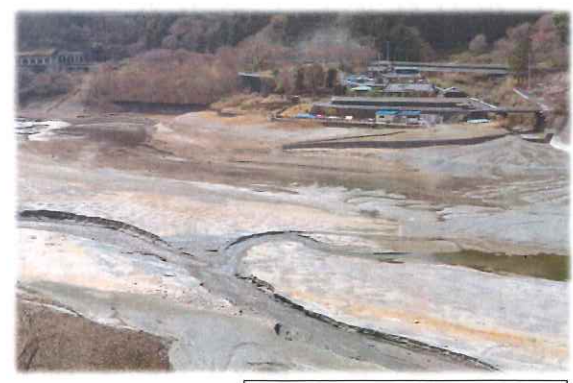
焼津のボート乗り場